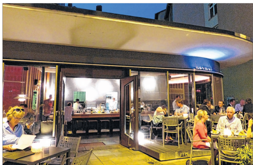
Als wär's ein Bild von Edward Hopper: Die »Heimat« an der Berliner Straße.